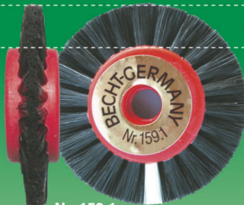
No.159.1 2列 レッド〈9mm〉 〈サイズ〉外寸:45mm / 内寸:25mm