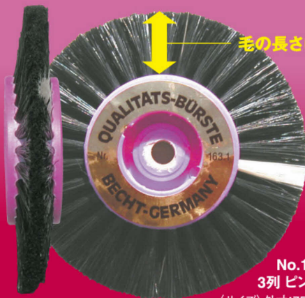
No.163.1 3列 ピンク〈大〉 〈サイズ〉外寸:75mm / 内寸:40mm

チタン研磨に耐えて効果的に使用できるのは、 スペシャルブラシ「メタル専用」のみ。