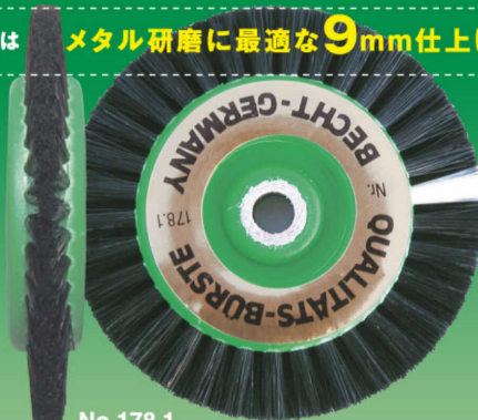
No.178.1 2列 グリーン〈9mm〉 〈サイズ〉外寸:60mm / 内寸:40mm

チタン研磨に耐えて効果的に使用できるのは、 スペシャルブラシ「メタル専用」のみ。