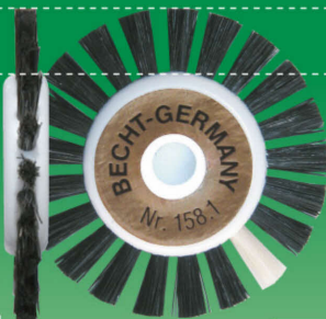
No.158.1 1列 ホワイト〈9mm〉 〈サイズ〉外寸:45mm / 内寸:25mm